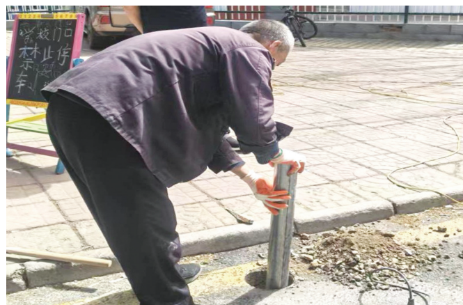
图为增设禁停路桩施工现场