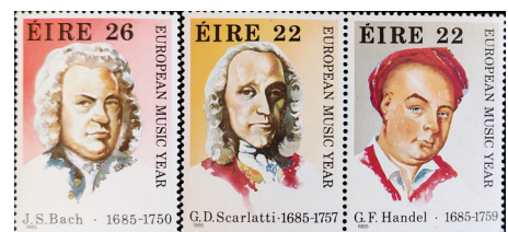
1985年爱尔兰发行的“欧洲音乐年”主题纪念邮票