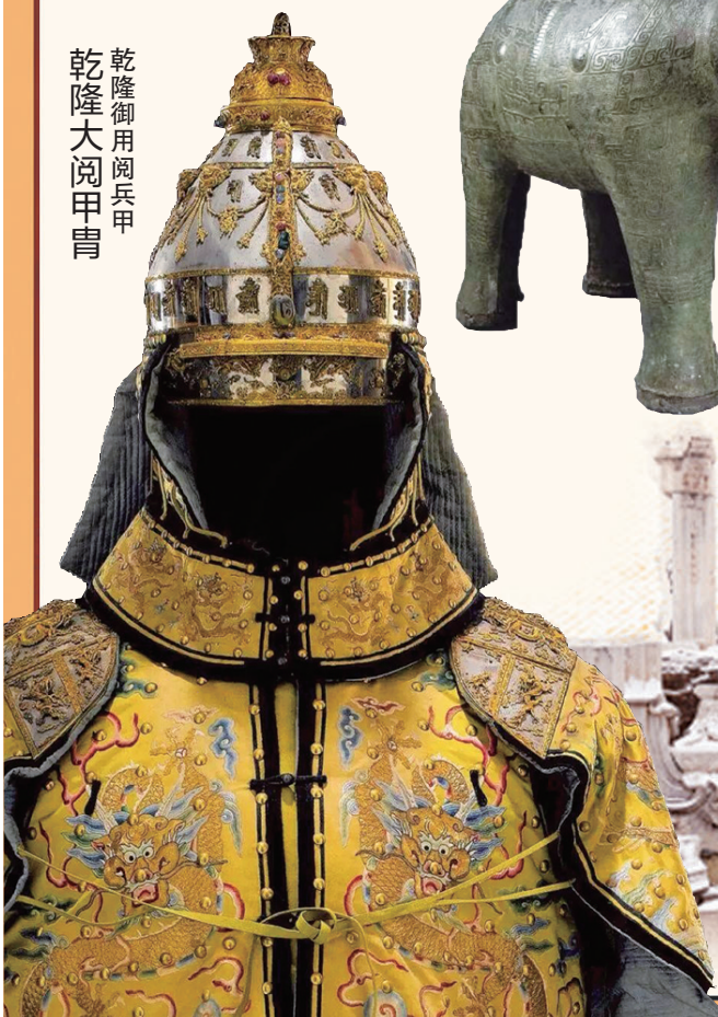
乾隆御用阅兵甲 乾隆大阅甲胄