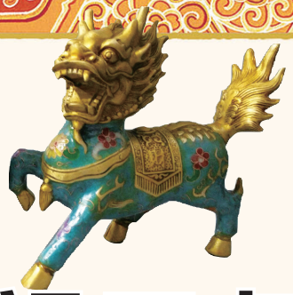
景泰蓝麒麟 曾为法国皇后枕边物