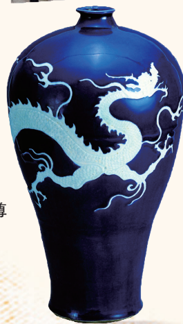
元霁蓝釉白龙纹梅瓶 全球仅三件,元代瓷器珍品。