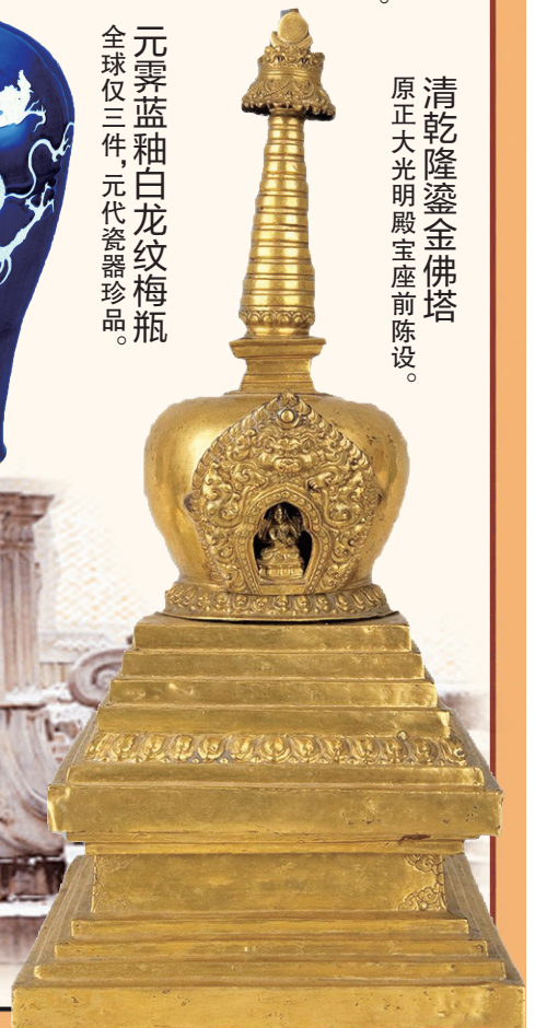
清乾隆鎏金佛塔 原正大光明殿宝座前陈设。