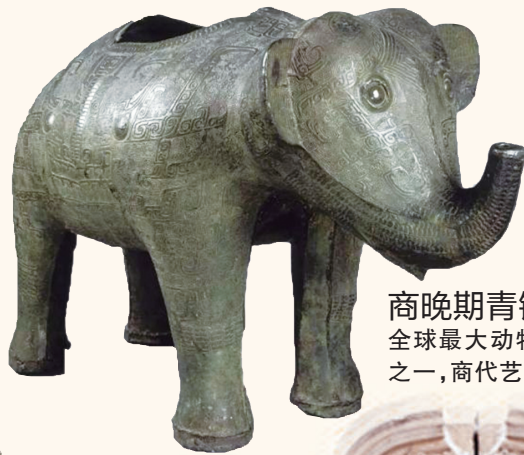
商晚期青铜象尊 全球最大动物形青铜尊之一,商代艺术巅峰。