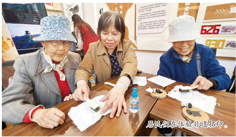
居民们在体验非遗拓印。