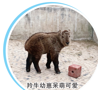
羚牛幼崽呆萌可爱

不多,可性格、颜值却差别很大。大哥肤色略深,性格沉稳,甚至有点胆小、害羞;老二体色比老大稍浅一点,一副“天不怕地不怕”的性格,活泼好动、气场超强,尤其干饭时更是霸气十足,总爱抢食,二者对比,趣味感直接拉满!“五一”假期它们也将外放展出,欢迎大家前来了解“生命的奇迹”。此外,还有不少鸟类、草食动物也正在生产、孵化,雏鸟、幼崽很快就能与大家见面了,期待与您相约“五一”假期!