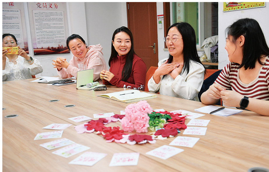
5月7日,老军营小区第三社区联合智慧父母读书会共同举行母亲节主题阅读沙龙分享会,在书香中感恩母爱,传承家风。