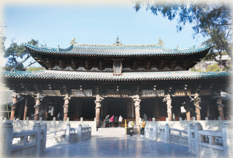
晋祠圣母殿(资料图)