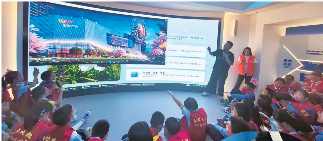
光影里的AI奇遇 五年八班 李思乐 摄