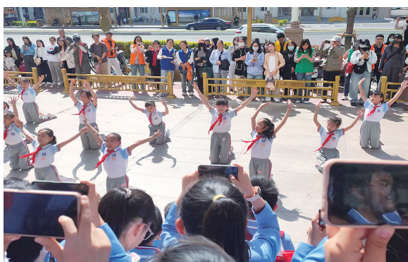
活力瞬间 五年七班 宋睿铨 摄