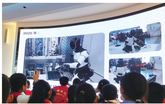
走进智能机器人的世界