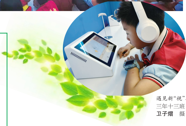
遇见新“视”界